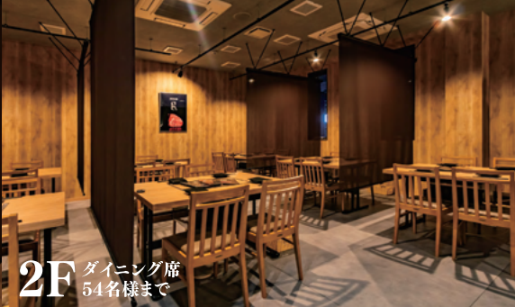
2F ダイニング席 54名様まで