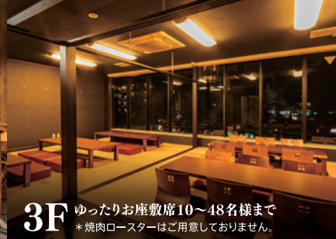
3F ゆったりお座敷席10~48名様まで *焼肉ロースターはご用意しておりません。