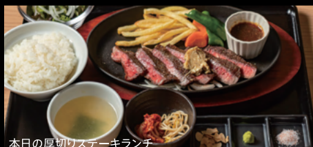
本日の厚切りステーキランチ