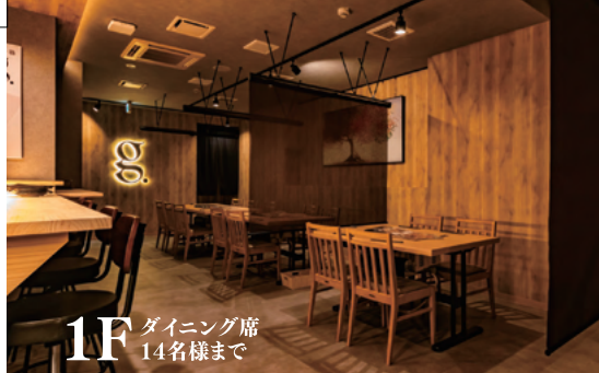
1F ダイニング席 14名様まで